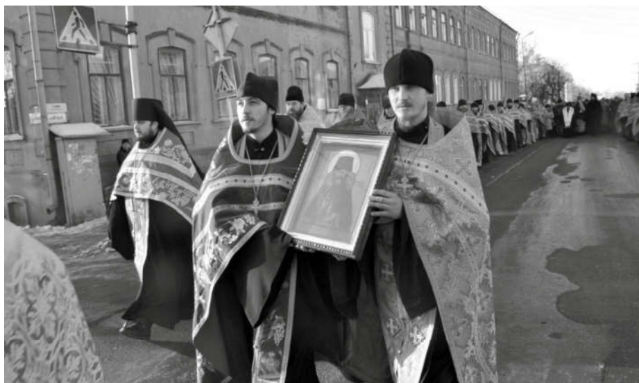
Крестный ход к часовне преподобного Матфея Яранского.

чтений завершилось просмотром документального фильма «Крестный путь. Земное и небесное».