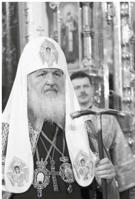
Святейший Патриарх Московский и всея Руси Кирилл.

Хрупкость нашей цивилизации должна укреплять в людях чувство веры и понимание того, что Бог совсем рядом. И там, где проявляются наша хрупкость, наше неумение, наши недостатки, Он приходит на помощь — тогда, когда мы Его об этом просим. Думаю, каждый из вас испытывал в жизни это чувство, когда из сердца исходит простая молитва: «Господи, помилуй!» — как говорили наши воины на поле брани, бросаясь в атаку, идя на смерть... Это самая простая молитва, но не забывайте ее и в спокойные, мирные моменты своей жизни, и в моменты смятения и трудностей.